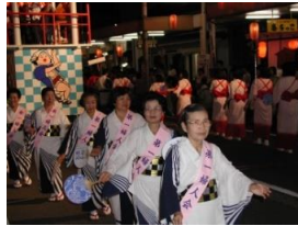
会津磐梯山庄助おどり