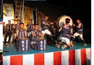
会津喜多方蔵太鼓