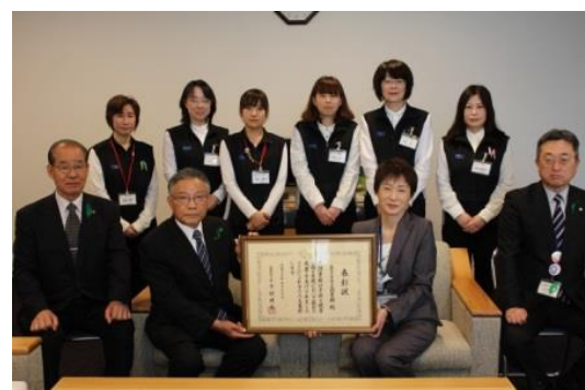
一市長室にて報告会一

平成27年4月23日(子ども読書の日)。 東京・国立オリンピック記念青少年総合センターにて、喜多方市立図書館が「子どもの読書活動優秀実践校・図書館・個人」文部科学大臣表彰を受賞しました。これは文部科学省が平成14年度から実施しており、子どもの読書を推進するために優れた活動をしている学校や図書館、個人をたたえた賞です。このような名誉ある賞をいただいた事、スタッフ一同大変喜びと共に一層励んでいく気持ちを新たに持ちました。