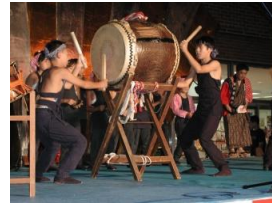
子どもまつり囃子

※時間に変更になる場合がございます。 お問い合わせ/喜多方観光物産協会 TEL 0241-24-5200