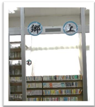
郷土コーナーは 図書館1階西側にあります。

図書館の郷土コーナーでは、福島・会津・喜多方に関する本を閲覧することができます。喜多方について知りたい事を調べてみませんか？