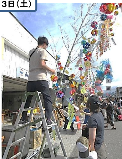
当日朝の飾り付け

喜多方市教育委員会文化課様 中央公民館様にお手伝いいただき 当日朝8時から七夕飾りを設置しました。