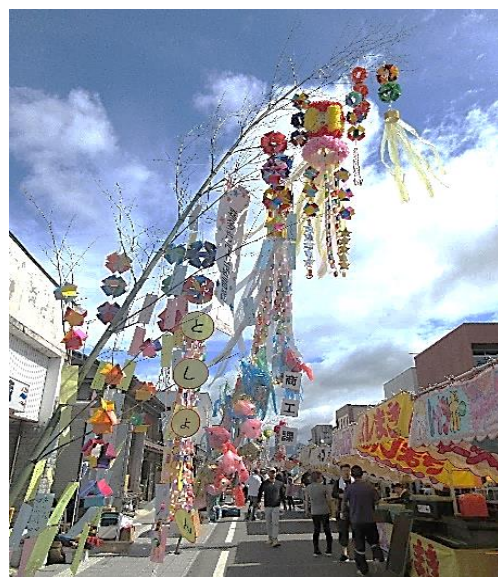
図書館の七夕飾り

喜多方市教育委員会文化課様 中央公民館様にお手伝いいただき 当日朝8時から七夕飾りを設置しました。