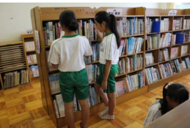
<本をきれいに整理しています>