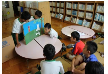
<よみ聞かせの練習中♪>

としよしつ 図書室の つた ルールを ほん みんなに せいり 伝えることや本の せいり 整理を がんば っています。