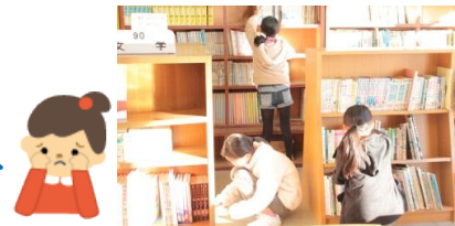
本をきれいに並べています