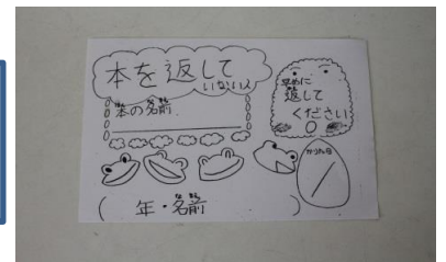
ほん かえ ひと わた ＜本を返していない人に渡すカード＞

ほん かしたし へんきやく ほん せいり ほん かえ ひと かくにん 本の貸出や返却、本の整理、本を返していない人を確認して、 はや かえ 早く返してもらうようにカードを書いています。