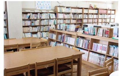
としよしつ ようす ＜図書室の様子＞