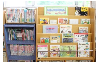
あたら ほん ＜新しい本のコーナー＞

としよいいん がんば 図書委員として頑張っているのは、本の貸出や本の整理です。 これからやってみたいことは、としよしつ 図書室のレイアウトをがらっと か 変えてみたいです。