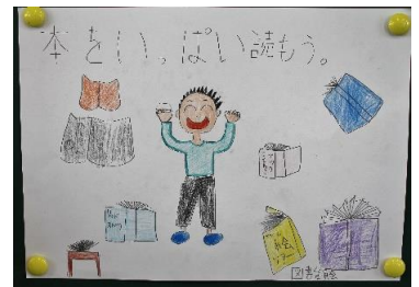
<呼びかけポスター>

本の貸出・返却、整理のほか、貸出を呼びかける校内放送 などを行っています。テレビやゲームの画面を見ないで過ごす 「オフスクリーン」の前日には、呼びかけ活動もしています。