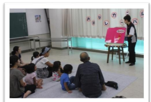
＜大型絵本のよみきかせ＞

日曜日に開催している「おはなしドライブ」のスペシャル版です。 絵本のほかに大型絵本やパネルシアター、手あそび、工作を おこないます。 前回のおはなしカーニバルでは、いもむしのお人形が登場したり、 ストローで飛行機をつくりましました。今年はどんな内容かな？ ぜひ参加してね。