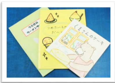
＜参加した人の作品＞

画用紙とのかみを使って、世界にひとつだけの手作りの絵本をつくりまします。絵本の内容は自由なので、 おはなしを書いたり、写真をはったり、しかけをしたり、毎年とってもすてきな作品ができまします。 夏休みの自由研究で絵本をつくるのはどうですか？絵本を作りたい子は、このおたよりの「たなばた フェスタのもよおしもの」を確認してね。