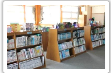
としよしつ ようす ＜図書室の様子＞

どうじましようがっこう 堂島小学校に通っている かよ 児童の じどう 人数と にんずう クラスの かず 数を教えてください。 また、 としよいいん 図書委員さんの がくねん 学年と にんずう 人数も教えてください。