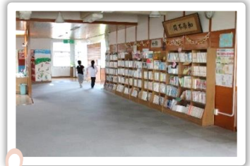
としよしつ まえ ほん 図書室の前にも本がたくさんあるんだね。