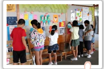
たのしい かざ 飾りがいっぱい！ ほん 本の しょうかい 紹介もあったよ。

としよいいん 図書委員をしていてうれしかったこと、 たの 楽しいことはどんなことですか。