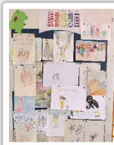
よ 読んだ本の かんそう 感想を イラストでかくのは たの たの 楽しそう！

どうじましようがっこう 堂島小学校で にんき 人気のある ほん 本を教えてください。