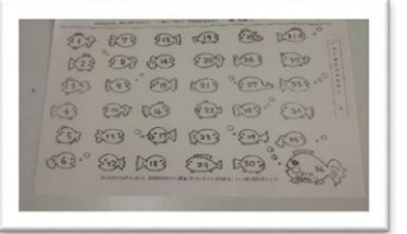
目指せブック王の用紙

お昼の放送で、主に低学年向けの絵本などの読み聞かせ をしています。また、教室に行き行って本を読んでもらえるように 呼びかけをおこなっています。その他に、11月からスタート した「目指せブック王」のプレゼント作りをしています。