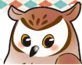
【マスコットキャラクター】『ミミ』